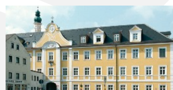
Fachakademie für Sozialpädagogik

Bismarckplatz 14, 84034 Landshut Christliches Bildungswerk Landshut e.V. Maximilianstr. 6, 84028 Landshut, Tel. 0871 / 923 17 0 info@cbw-landshut.de | www.cbw-landshut.de